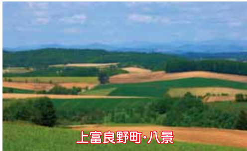
上富良野町・八景

2013年度にふらびズムで取り上げたエリアは上川地方の南部です。富良野市を中心に上富良野町、中富良野町、南富良野町、そして占冠村です。地域の暮らしぶりやさまざまな方にご登場いただきましたが、各観光協会の関係者にご登場いただき、地域自慢をしてもらいました。ここでは少しだけ、ご紹介。恵まれた景観、メリハリのある季節、個性あふれる隣人たち…と、異口同音に語られる内容は共通していますが、それぞれの地域の個性が光りました。詳しい続きはサイトでどうぞ。